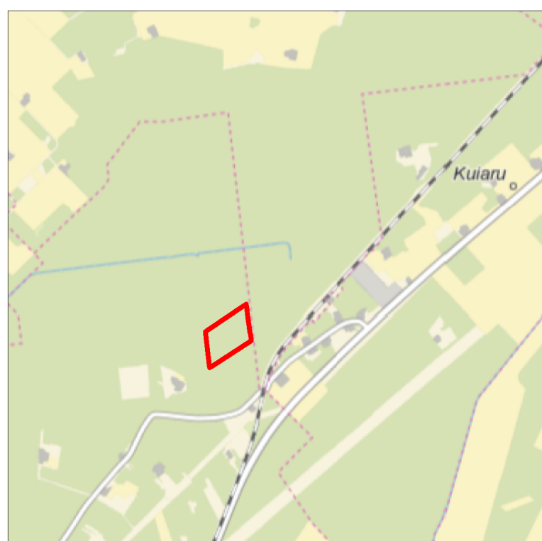
Kaardileht nr 5334 Pärnu-Jaagupi